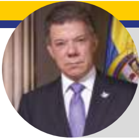
Juan Manuel Santos Calderón Presidente de la República de Colombia